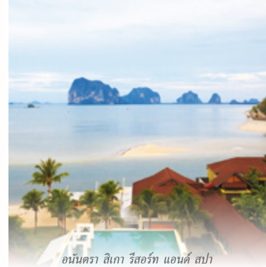
อนันตรา สิเกา รีสอร์ท แอนด์ สปา

เงื่อนไข: สำหรับโรงแรม: ข้อเสนอใช้ได้กับสมาชิกบัตรออด ออริค พลัส เท่านั้น โดยไม่สามารถเข้าร่วมกับรายการส่งเสริมการขายอื่น ไม่สามารถใช้ได้ในช่วงวันหยุดราชการ ช่วงวันหยุดยาว เทศกาลเฉลิมฉลอง หรือเทศกาลท่องเที่ยว ข้อเสนอไม่สามารถใช้ได้กับการจองเป็นหมู่คณะ การจองเพื่อหมู่ประชุม และการจัดนิทรรศการต่างๆ ทั้งนี้ โรงแรมและรีสอร์ทในเครือเซ็นทาราของสวนสิเกา ในการยกเลิกหรือแก้ไขการสำรองห้องพักในกรณีที่ไม่มีไปตามกฎเกณฑ์และเงื่อนไขที่กำหนด สำหรับห้องอาหาร: ข้อเสนอสำหรับสมาชิกบัตรออด ออริค พลัส เท่านั้น และไม่สามารถเข้าร่วมกับ รายการส่งเสริมการขายอื่น หรือกับรายการส่วนลดพิเศษอื่นๆ หากมิได้ระบุไว้ รวมถึงไม่สามารถใช้ได้ในวันหยุดราชการและวันหยุดเทศกาลต่างๆ กรุณาสำรองห้องพักล่วงหน้าผ่านศูนย์สำรองห้องพัก และขึ้นอยู่กับจำนวนห้องพักที่ว่าง สำหรับสปา: *ข้อเสนอสำหรับสมาชิกบัตรออด ออริค พลัส เท่านั้น โดยไม่สามารถใช้ได้ที่เซ็นทารา ชานทะเล รีสอร์ท แอนด์ วิลล่า ทรายดำและไม่สามารถเข้าร่วมกับ รายการส่งเสริมการขายอื่นได้ ทั้งนี้ สามารถใช้ได้เฉพาะสปาที่ริตเมนต์แบบ A La Carte ซึ่งไม่รวมบริการที่เล็บและแว็กซ์ ข้อเสนอมีคิรับจองล่วงหน้าเวลา 10:00 น. - 16:00 น. ทุกวัน กรุณา สำรองล่วงหน้า และขึ้นอยู่กับบริการที่ว่าง ทั้งนี้ อัตราค่าบริการเป็นไปตามอัตราค่าที่ตีพิมพ์ รวมถึงค่าใช้จ่ายในเรื่องค่าภาษี และค่าธรรมเนียมต่างๆ ตามที่กำหนด